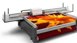
Oryx 4 Images